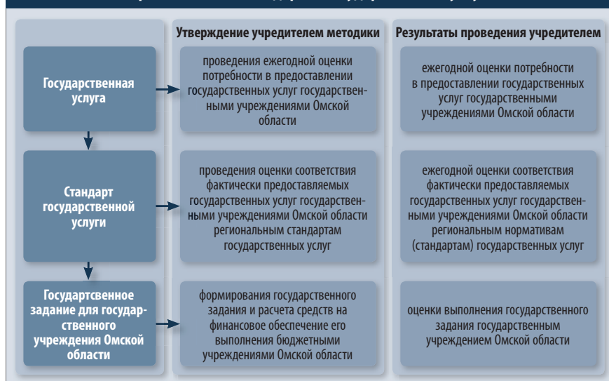
Схема 4. Система региональных стандартов государственных услуг Омской области

Перспективы развития бюджетной системы региона заключаются в дальнейшем реформировании всех ее составляющих с учетом новых требований нормативно-правовой базы, в повышении качества предоставления государственных и муниципальных услуг, в переходе к программной структуре бюджета, в совершенствовании системы межбюджетных отношений и качества управления муниципальными финансами, в оптимизации функций государственного управления. ●