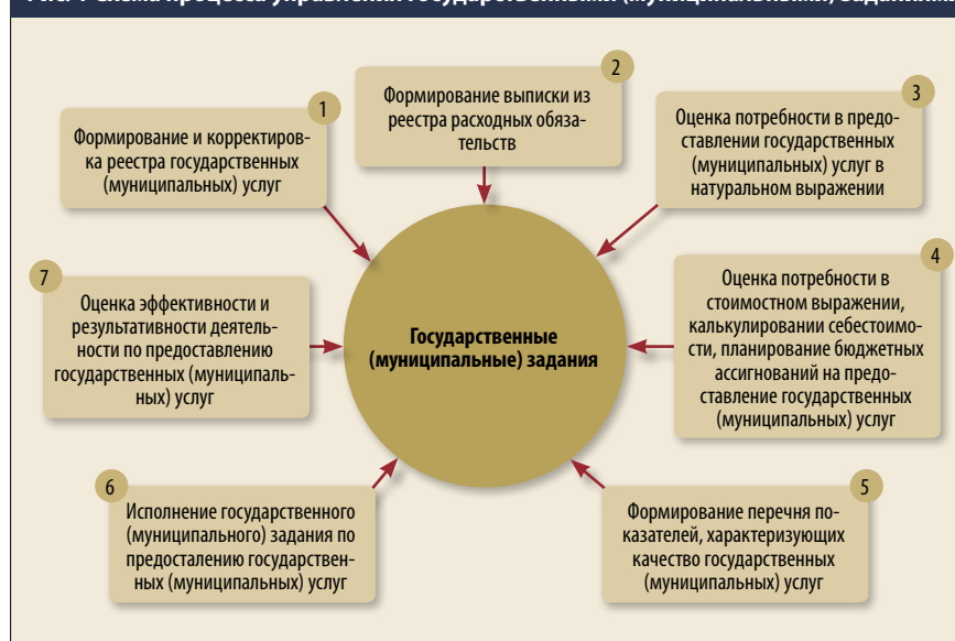
Рис. 1 Схема процесса управления государственными (муниципальными) заданиями

сти корректируются отраслевые реестры государственных (муниципальных) услуг.